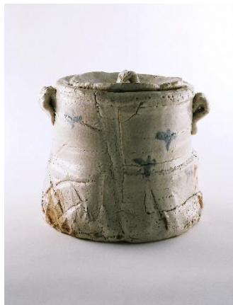
荒川丰藏《志野水指》1938-41 年 岐阜县现代陶艺美术馆藏

本次展会，聚焦昭和初期以来的复古潮流，介绍近代美浓陶艺的发展历程。讲述了陶艺家尊重传统的同时又实现了创新发展的历史进程。敬请欣赏。