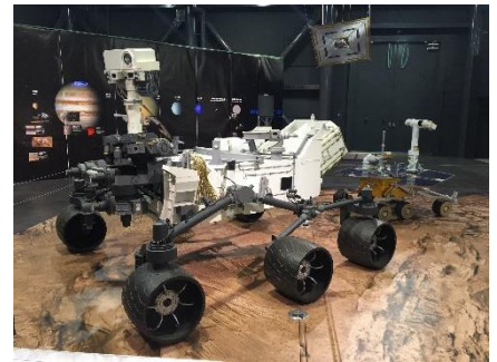
好奇号 (Curiosity) 火星探测车

空宙馆迎来新装开业一周年。举办大人小孩都能玩得开心的纪念活动。除了有受欢迎的水火箭发射体验、纸飞机制作外，还会举办以火星为主题的特别展等各种活动。