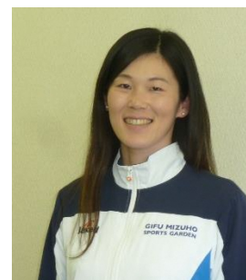
(acima) Rie Kaneto , embaixadora do torneio (esquerda) Imagens da aula de beisebol

Em setembro será realizado pela primeira vez em Gifu, o evento esportivo "Sports Masters Japan" que reunirá atletas com mais de 35 anos. Este será um evento comemorativo dos 100 dias para a realização do evento e haverá aulas experimentais de esportes ministrados por Rie Kaneto,