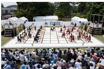
"Tozai Ningen Shogi" Sekigahara – Campo da divisão de poderes

Será realizado um evento com foco na Batalha de Sekigahara e no confronto leste e oeste. O evento contará com o "Tozai Ningen