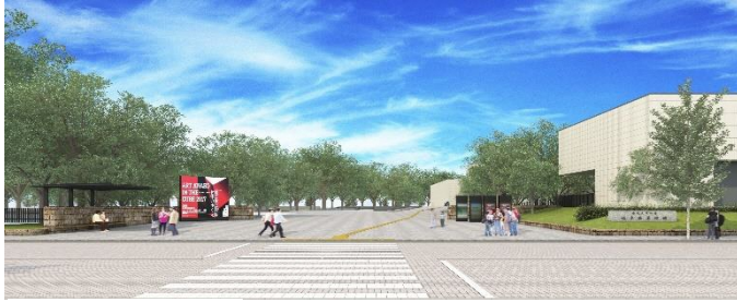
新装的南门(效果图)

县图书馆为了方便所有来馆者的使用,贴心地设置了停车场和哺乳室,变身为“贴心的美术馆”。计划将县美术馆和县图书馆中间的道路打造成步行街,举行“清流之国岐阜文化森林秋季活动”。