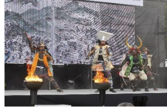
重现关原之战情景的舞台秀