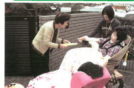
地域の方に案内状を手渡し

みんな なかよし つなごう 人と人 心と心 あなたの心を行動に 磨こう人権感覚 つくりあげよう共生社会 心と心で支え合い 笑顔あふれる毎日に