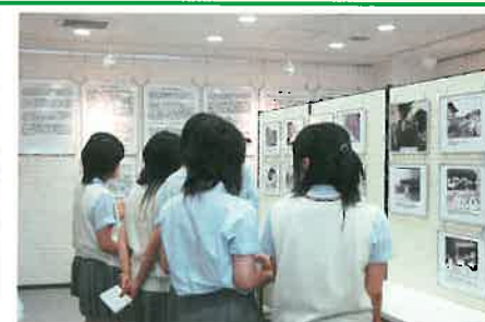
人権課題の展示会