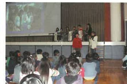
地域の方とディスカッション