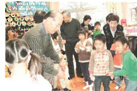
おじいさんたちと仲良く

2年目にあたる本年度においては、人権週間（毎年12月4日～10日）のうち、各園・学校が設定する日を中心に、人権に関する各学校の1年間の取組の集大成となるような活動や、家庭や地域と連携した活動等が行われました。各学校において、工夫ある活動や計画的、継続的なすばらしい活動が行われる中、子どもたち一人一人が自分を見つめたり、これから自分はどうしていきたいかを考えたり、ひたむきに活動に取り組んだりするといったすてきな姿がたくさん生まれています。