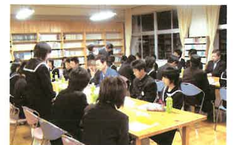
保護者の方との討論会