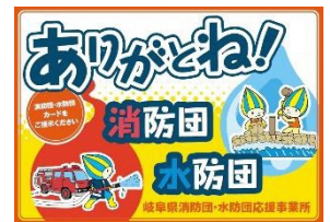
Selo do Programa "Arigato ne! Estabelecimento Apoiador do Shobodan e Suibodan "

É um programa de cadastro de empresas que oferece alguns benefícios tais como desconto para os integrantes do shobodan e suibodan com o intuito de apoiá-los. Estamos recrutando lojas que queiram aderir ao sistema.