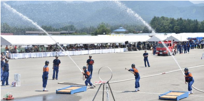
Imagens do Campeonato de Habilidade dos Bombeiros da Província 2019

Os membros do shobodan são trabalhadores assalariados, autônomos, estudantes e inclusive donas de casa. Qualquer pessoa com mais de 18 anos pode se tornar um membro. Que tal se tornar um membro do shobodan em prol da sua comunidade?