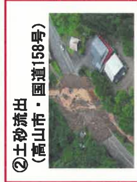
②土砂流出 (高山市・国道158号)