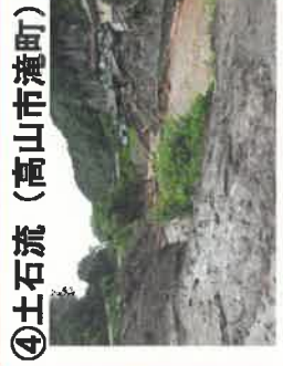
④土石流 (高山市滝町)