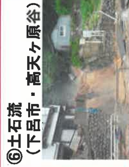
⑥土石流 (下呂市・高天ヶ原谷)