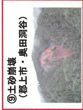
⑨土砂崩壊 (郡上市・奥田洞谷)