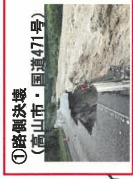
①路側決壊 (高山市・国道471号)