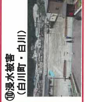
⑩浸水被害 (白川町・白川)