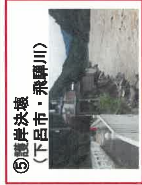
⑤護岸決壊 (下呂市・飛騨川)

※7月18日 15時00分時点 【人的被害】軽傷1名 【住家被害】半壊14棟、一部損壊64棟、床上浸水75棟、床下浸水282棟 【鉄道被害】JR高山線 飛騨小坂～渚間 不通 【道路】261箇所【河川】186箇所【砂防施設】26箇所 【農地】197箇所【農業用施設】144箇所【山地】39箇所【林道】180路線 等