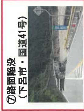
⑦路面陥没 (下呂市・国道41号)