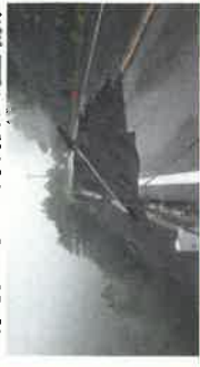
③路側決壊 (高山市・乗鞍公園線)