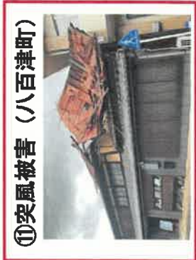
⑩突風被害 (八百津町)