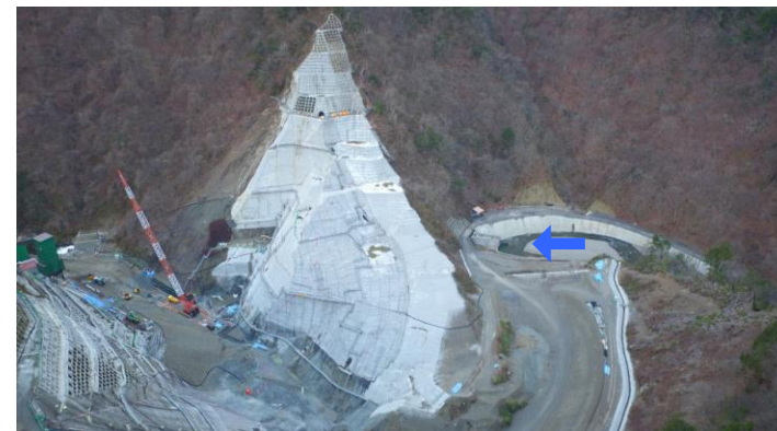
④ ダムサイト右岸状況(左岸上空より望む)