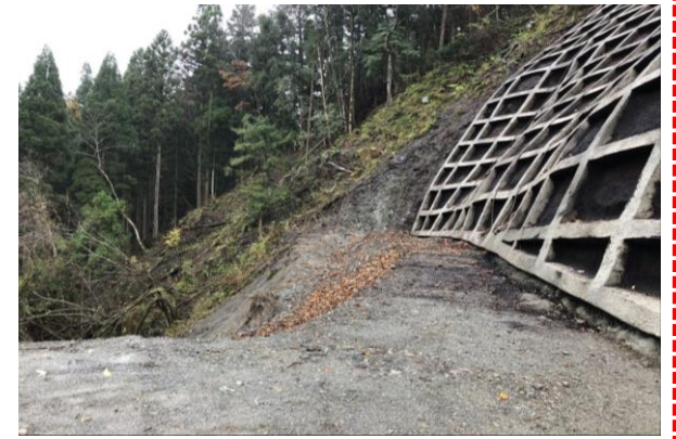
⑤ 下流工事用道路状況