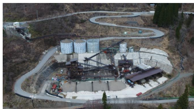
⑥ 骨材プラント状況(川側より望む)