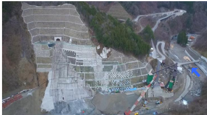
③ ダムサイト左岸状況(右岸上空より望む)