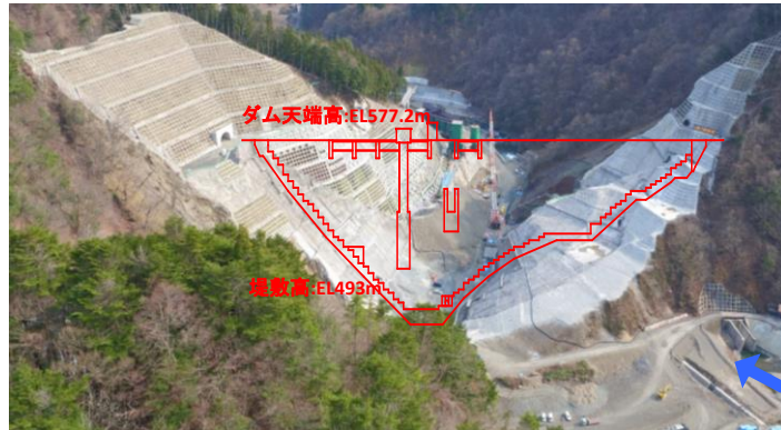
① ダムサイト状況(上流上空より望む)