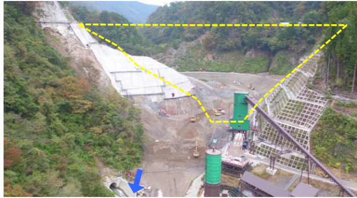
① ダムサイト状況(遠景:下流上空より望む)