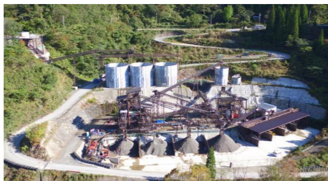
⑥ 骨材プラント状況(川側より望む)