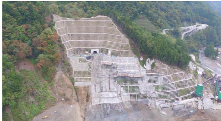
③ ダムサイト左岸状況(右岸上空より望む)