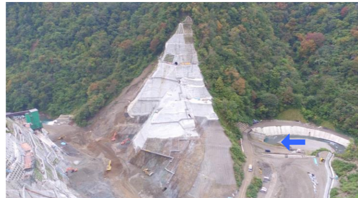
④ ダムサイト右岸状況(左岸上空より望む)