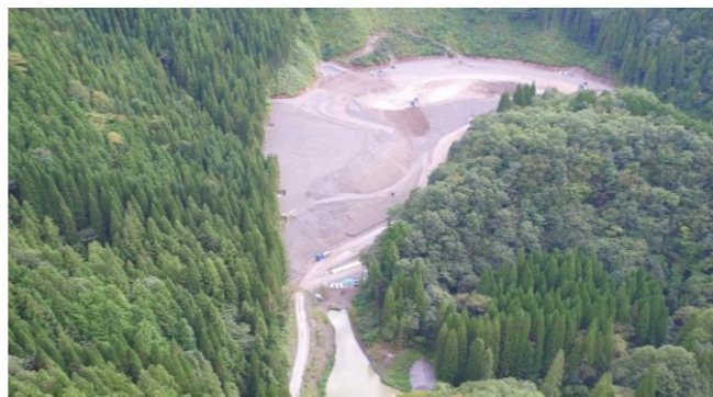
⑥ 土捨場状況(上空より望む)