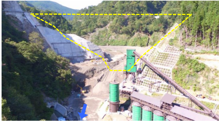
① ダムサイト状況(遠景:下流上空より望む)