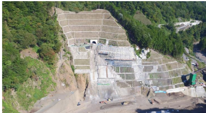
③ ダムサイト左岸状況(右岸上空より望む)