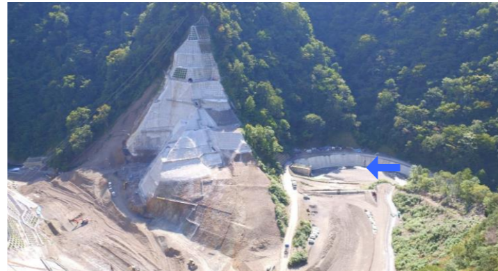
④ ダムサイト右岸状況(左岸上空より望む)