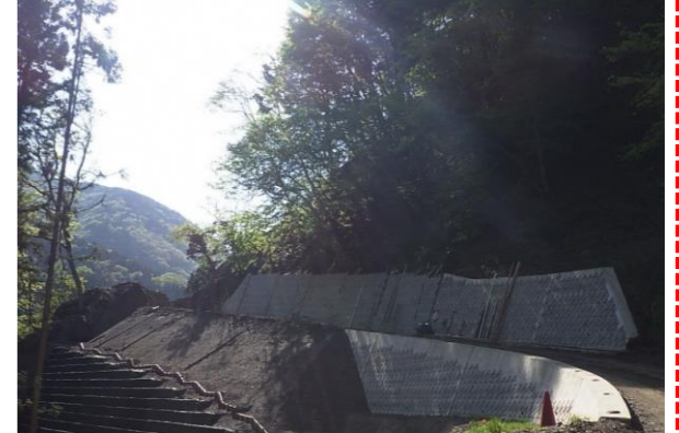
⑤ 下流工事用道路状況