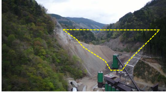
① ダムサイト状況(遠景:下流上空より望む)