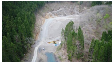
⑥ 土捨場状況(上空より望む)