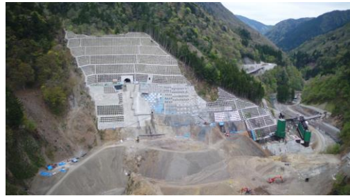
③ ダムサイト状況(右岸上空より望む)