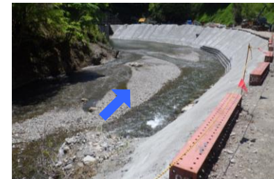
⑦ 上流工事用道路状況