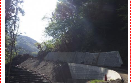
⑤ 下流工事用道路状況