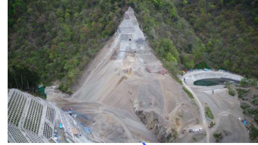
④ ダムサイト状況(左岸上空より望む)