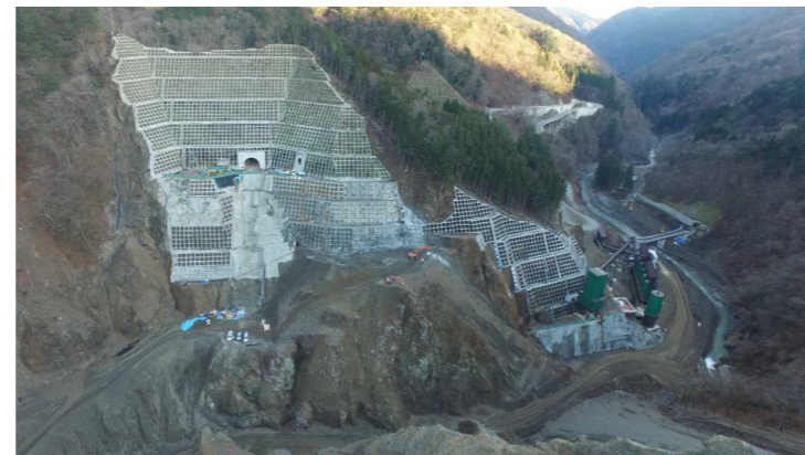
③ ダムサイト状況(右岸上空より望む)