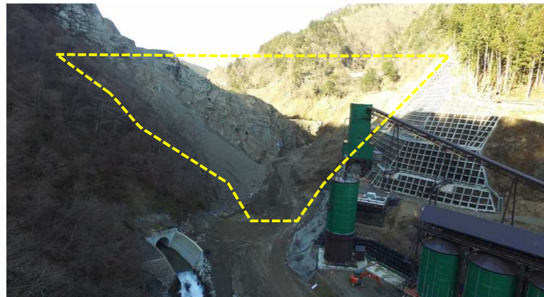
① ダムサイト状況(遠景:下流上空より望む)