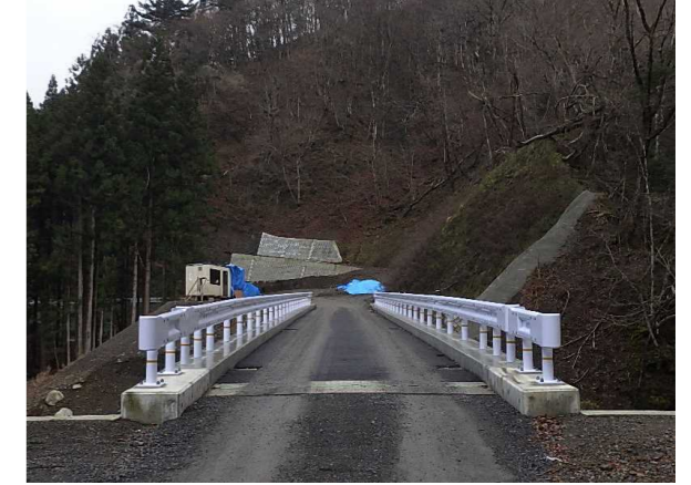
⑤ 下流工事用道路状況