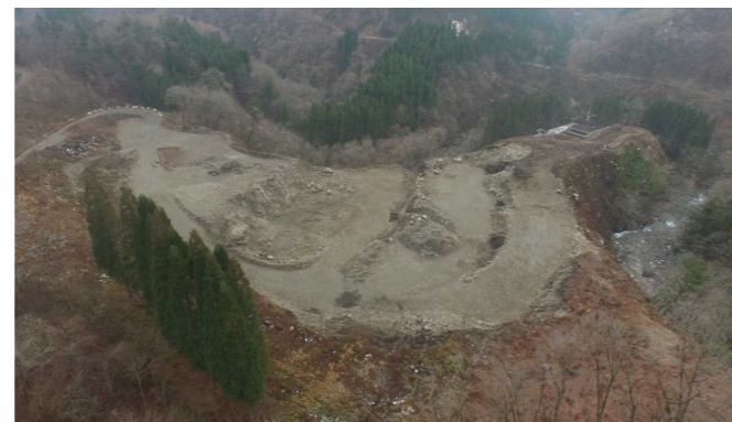
⑦ 原石山状況(上空より望む)