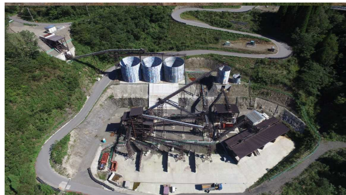
⑥ 骨材プラント状況(上空より望む)