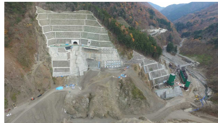
③ ダムサイト状況(右岸上空より望む)