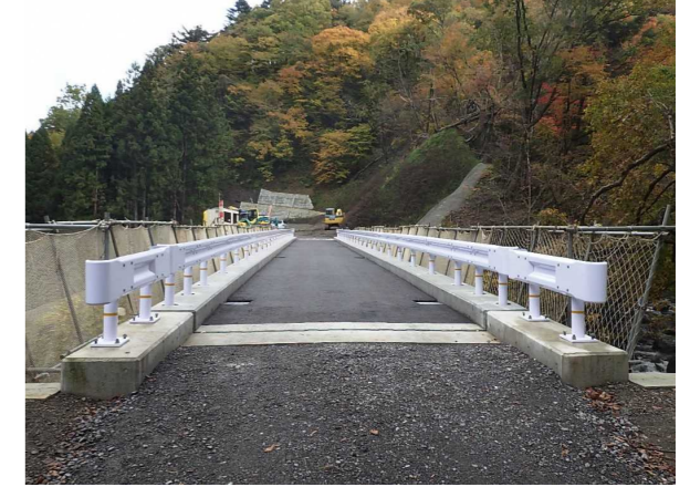
⑤ 下流工事用道路状況