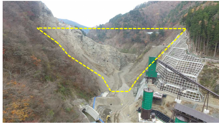
① ダムサイト状況(遠景:下流上空より望む)