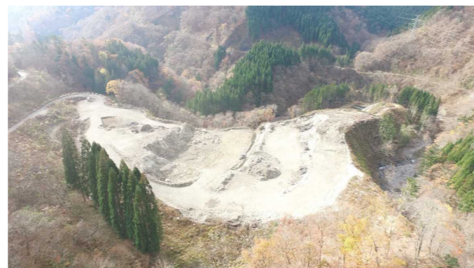
⑦ 原石山状況(上空より望む)