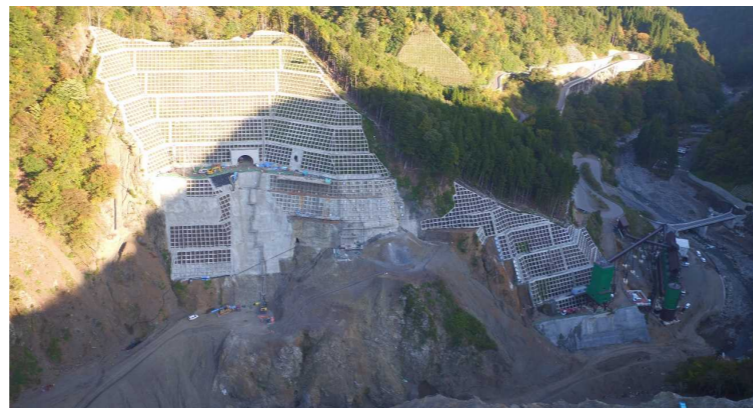
③ ダムサイト状況(右岸上空より望む)