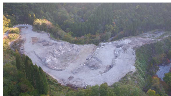
⑦ 原石山状況(上空より望む)