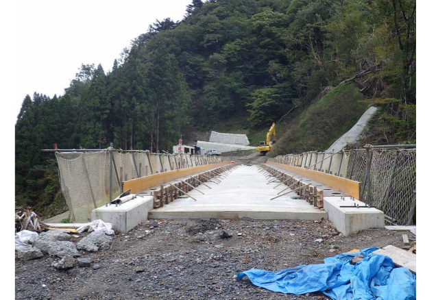
⑤ 下流工事用道路状況