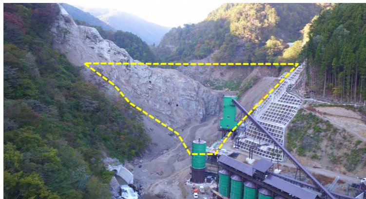
① ダムサイト状況(遠景:下流上空より望む)