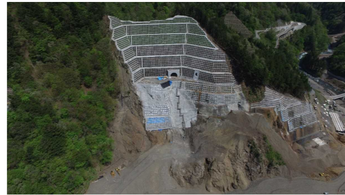
③ ダムサイト状況(右岸上空より望む)