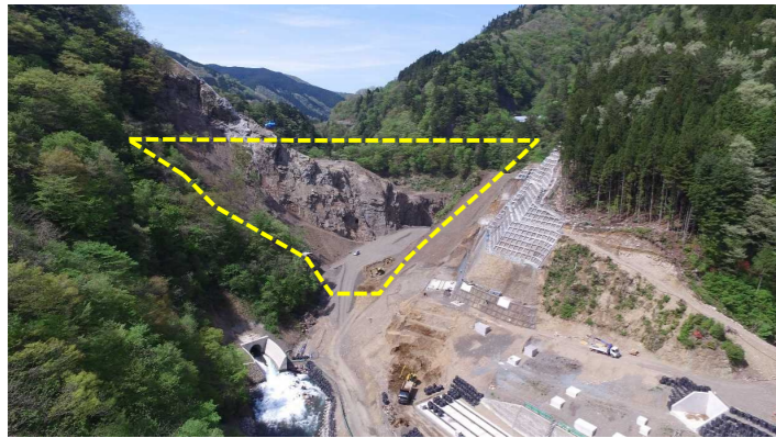
① ダムサイト状況(遠景:下流上空より望む)