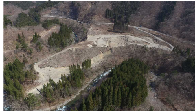
⑦ 原石山状況(上空より望む)