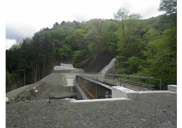
⑤ 下流工事用道路状況