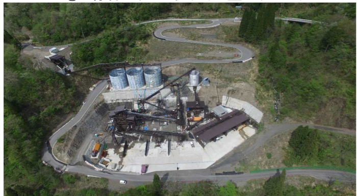
⑥ 骨材プラント状況(上空より望む)