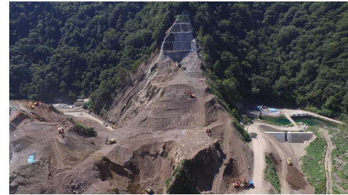
④ ダムサイト状況(左岸上空より望む)