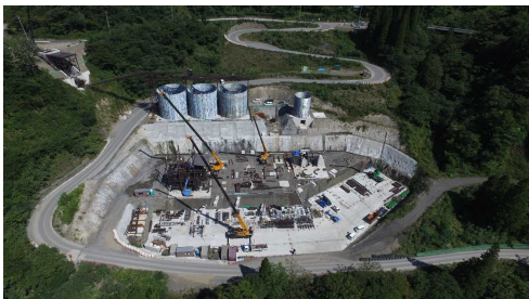
⑥ 骨材プラント状況(上空より望む)