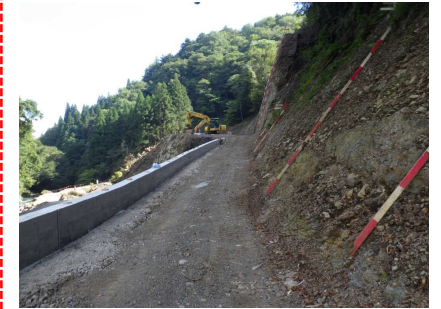
⑤ 下流工事用道路状況