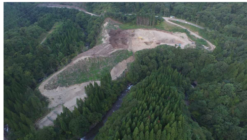
⑦ 原石山状況(上空より望む)