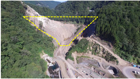
① ダムサイト状況(遠景:下流上空より望む)