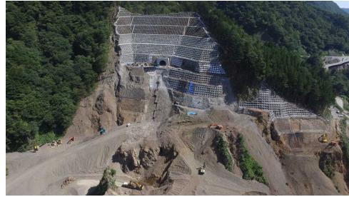
② ダムサイト状況(右岸上空より望む)