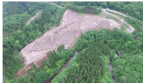
⑦ 原石山状況(上空より望む)