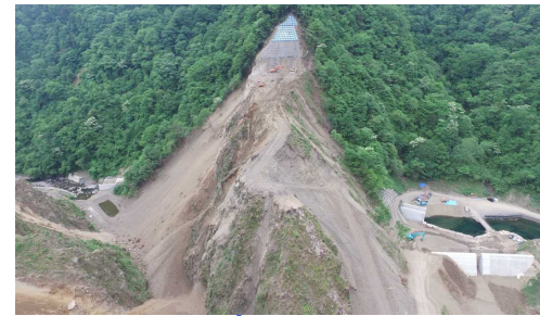
④ ダムサイト状況(左岸上空より望む)