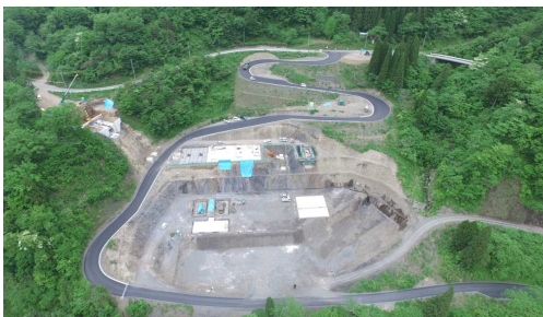
⑥ 骨材プラント状況(上空より望む)