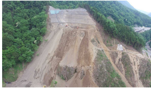
② ダムサイト状況(右岸上空より望む)