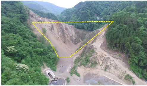
① ダムサイト状況(遠景:下流上空より望む)