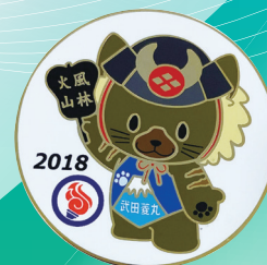
2018年 富士の国やまなし国体