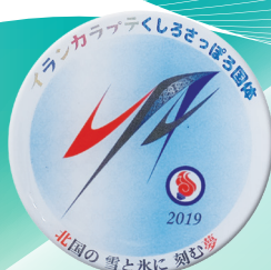
2019年 イランカラブテクしろさっぽろ国体