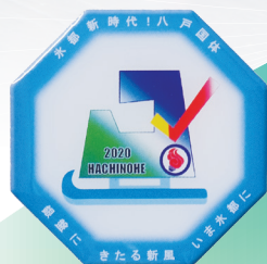
2020年 氷都新時代！八戸国体