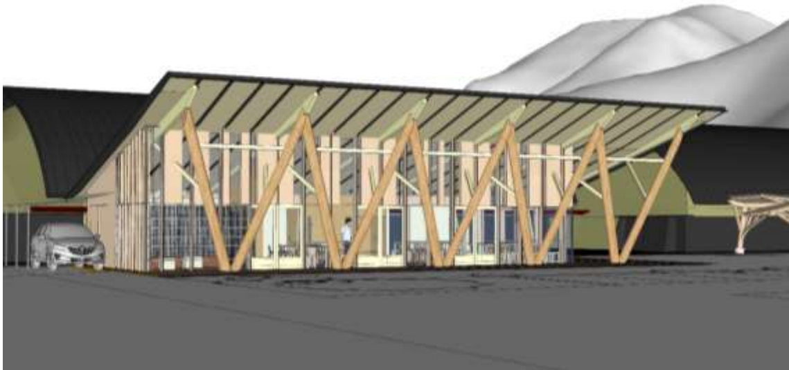
【森林総合教育センター（仮称）センターハウスイメージ図】