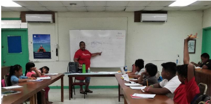
小学3・4年生（掛け算）

また父親が日本人の小3の子供が暗算で計算すると、先生はとても驚いていました。日本の小学校では暗算も教えますが、こちらの先生たちは教えません。暗算を教えてもらった経験がないので教えられないのです。教師用の指導書には指導法が書いてありますが…。