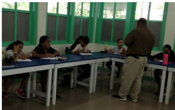
小学4・5年生（小数の掛け算と割り算）

中学1・2年に相当する7・8年生のクラスでは、正の数や負の数の計算練習をさせていました。日本の中学生も計算ミスをするところです。数学に興味を持つように、この先生はいろいろな数学の話もしていました。ビデオの視聴もさせていました。今週は、私がカードを使った学習法を紹介しようと思っています。