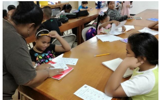
小学3・4年生（繰り上がりのある足し算）

中学1・2年に相当する7・8年生のクラスでは、正の数や負の数の計算練習をさせていました。日本の中学生も計算ミスをするところです。数学に興味を持つように、この先生はいろいろな数学の話もしていました。ビデオの視聴もさせていました。今週は、私がカードを使った学習法を紹介しようと思っています。