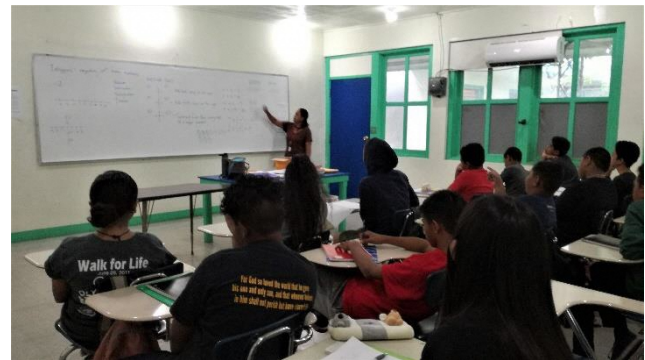
小学7・8年生（正の数と負の数）

今回は算数研究部会、JICA ボランティア活動報告会、小学生の夏期講習会の報告でした。どれも私の仕事に関することなので、専門的な話が多くなりました。私が日本やマレーシアの学校で算数や数学を教えていたとも、ここで述べたような問題がありました。