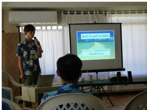
平野隊員（ジョージBハリス小学校）