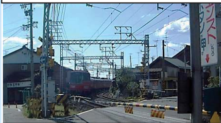
②名鉄岐阜駅手前の曲線