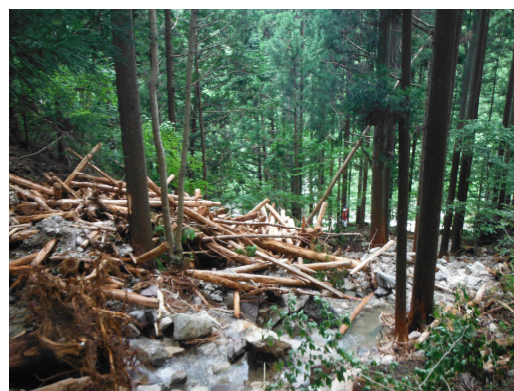
林内で土砂・流木が堆積している状況

（款）6 農林水産業費（項）5 林業費（目）(5) 治山費 （明細書事業名）○単独事業 治山事業費