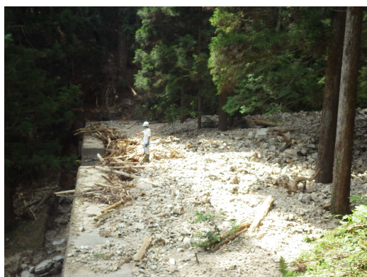
谷止工で土砂流出を防いでいる状況