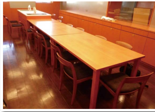
地域の交流拠点施設(加茂野交流センター)に導入した県産材家具(美濃加茂市)