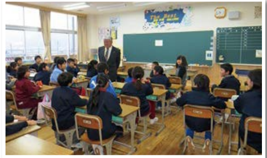
八幡小学校 (池田町)