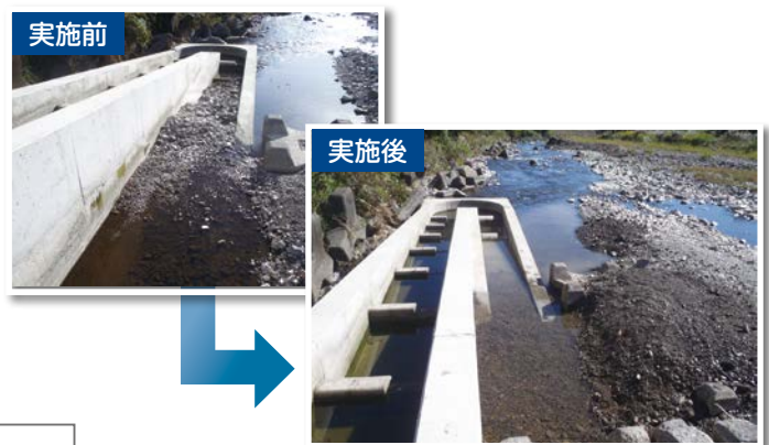
魚道の修繕状況(大垣市 藤古市)