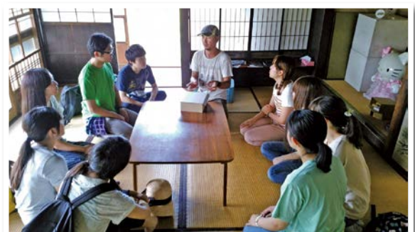
エコツアープログラムの作成検討会