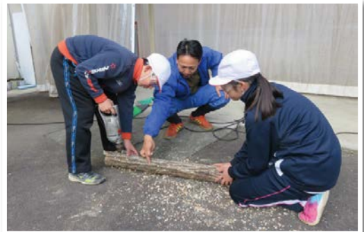
緑と水の子ども会議の実施 (神淵小学校(七宗町))