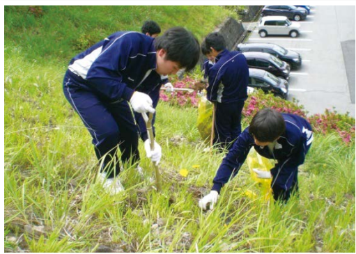
地元高校生(県立古城高校)による特定外来生物のボランティア防除作業(飛騨市)