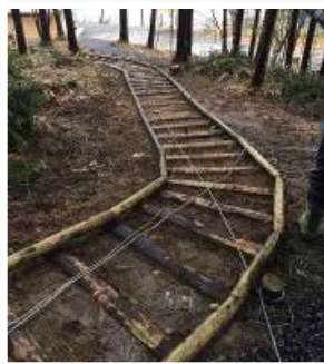
第4号中津川市加子母福崎の森 (木馬道)