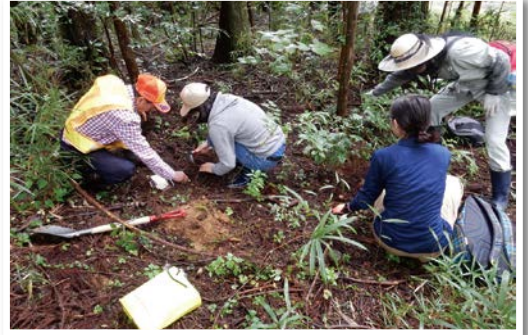
わな捕獲技術向上研修会