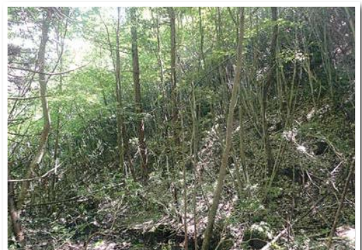
公有林化された森林