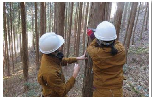
木の混み具合の調査