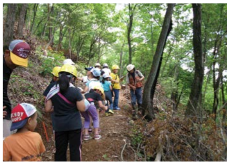
第1号美濃市古城山 (自然観察会として活用)