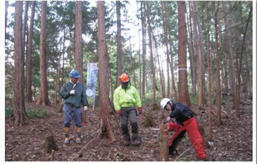
チェーンソーの使い方講習会 (吉田地域活性化委員会)