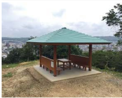
第3号土岐市高山城跡の森 (東屋)