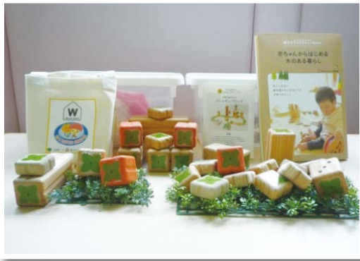
誕生祝品として開発した木のおもちゃ(大野町)