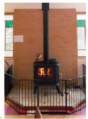
導入された薪ストーブ (中津川市)