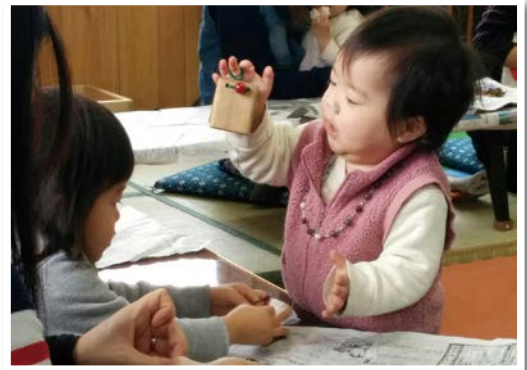
木育教室での教材として活用 (アップル子育てサポートセンター)