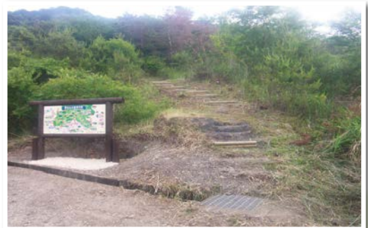
第5号揖斐川町城台山 (遊歩道)