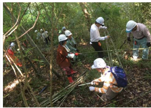
森林整備体験講座の開催(美濃加茂市)