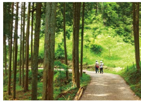
第2号可児市我田の森 (森林散策の場として活用)