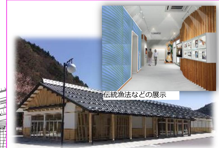
伝統漁法などの展示