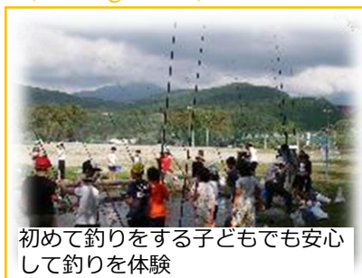
初めて釣りをする子どもでも安心して釣りを体験