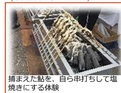
捕まえた鮎を、自ら串打ちして塩焼きにする体験