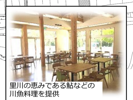
里川の恵みである鮎などの川魚料理を提供