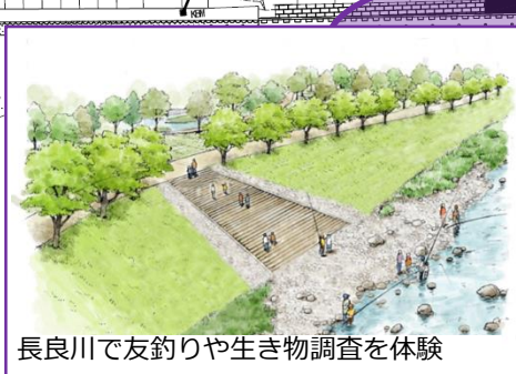
長良川で友釣りや生き物調査を体験