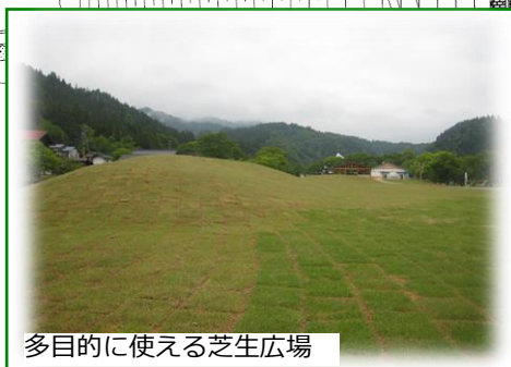
多目的に使える芝生広場