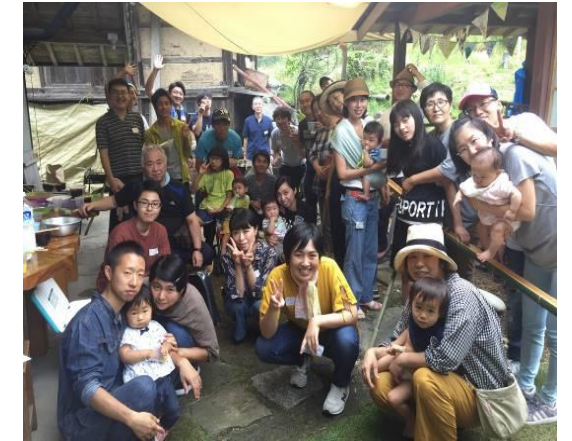
移住者交流会 「流しそうめん大会」

移住検討者の多くは、観光等で高山市に来て良いイメージを持っている方です。滞在期間中、機会をみつけて、わたしたちが移住してきた経験をご紹介します。良いところのみではなく、移住してきたからの苦労話もです。少しでも私たちの経験が役に立てば幸いです。気軽にお問合せください。