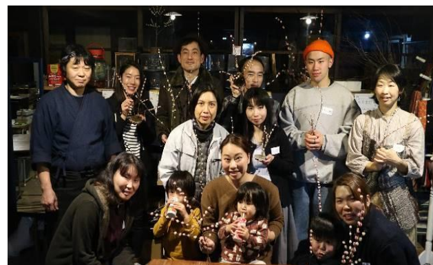
移住者交流会 「移住者で飛騨の味を楽しむ会」