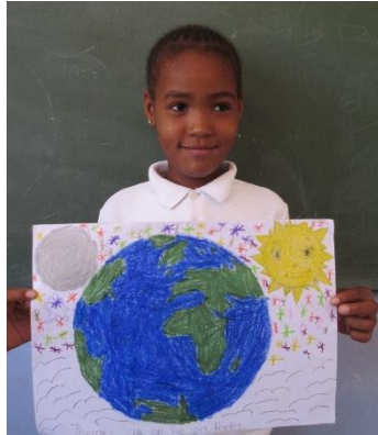
日本のコンテストに応募しました。 テーマは「We All Live on Earth」