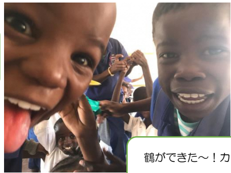
鶴ができた～！カメラに押し寄せる4年B組

折り紙は、いい単元が思いつかず、「つなぎ」でやりました。正直なところ、算数で精いっぱい、十分な準備ができたとは言えません。ナミビアの芸術は、図工、音楽、ダンス、演劇を含みます。ダンスと劇も準備したいです。