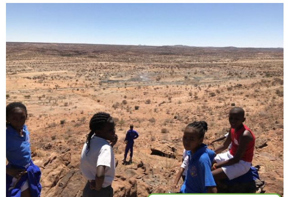
学校の裏山からの景色