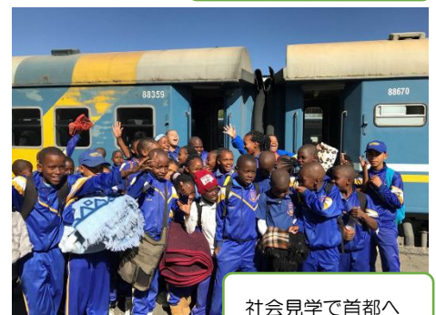
社会見学で首都へ