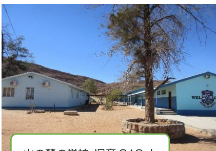
山の麓の学校。児童 319 人