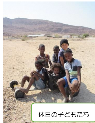
休日の子どもたち