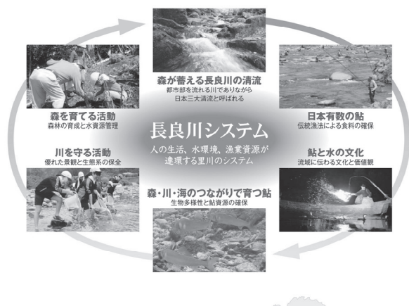
図2-4-3 長良川システム

今後、「清流長良川の鮎」を進化させながら、将来にわたり守り伝えるため、世界農業遺産「清流長良川の鮎」アクションプランに基づく取組みを着実に進める。