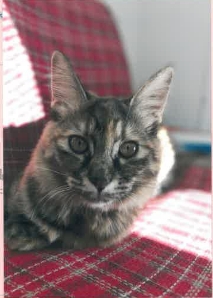
写真を貼 (同封していた)