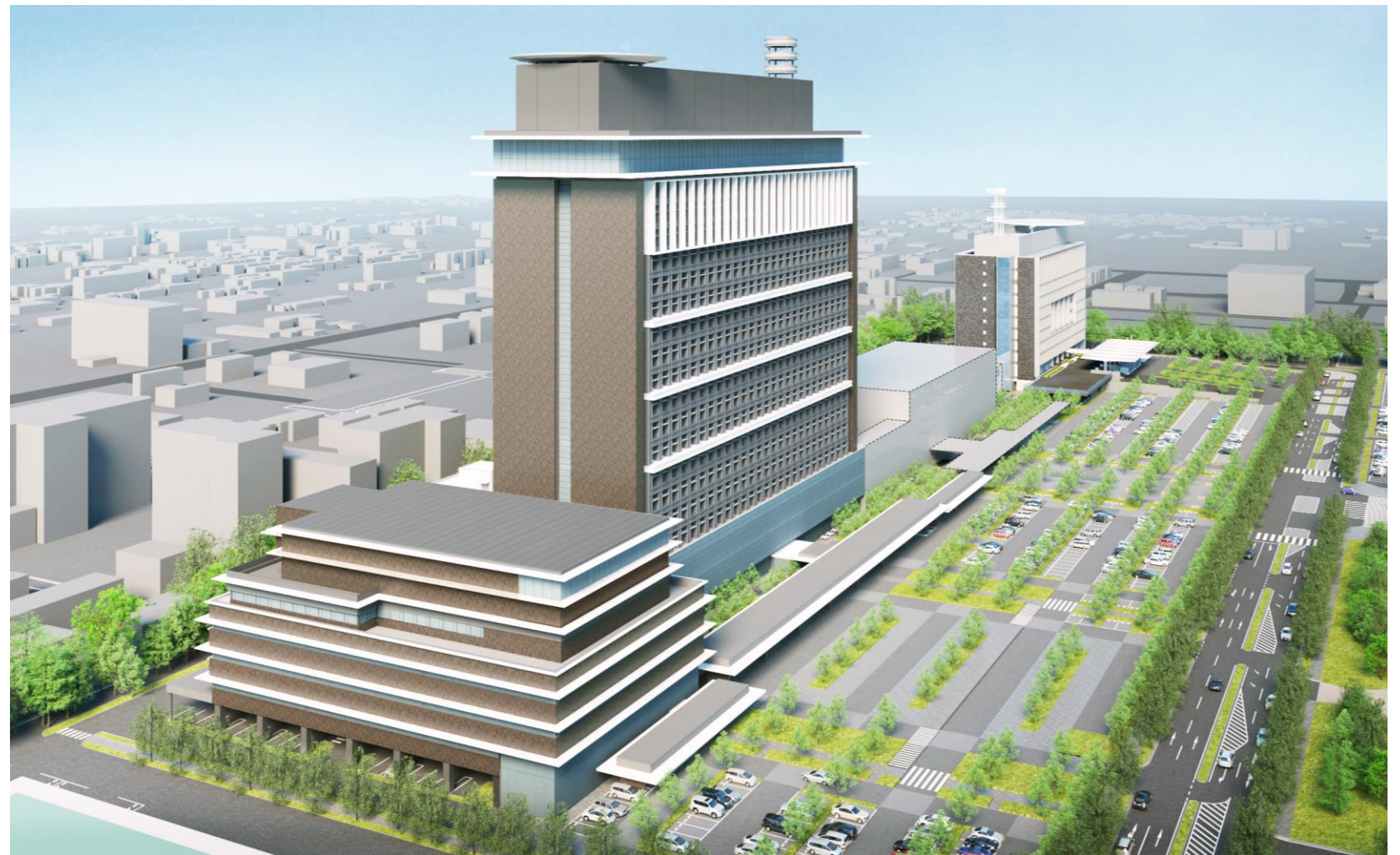
新庁舎外観イメージ図