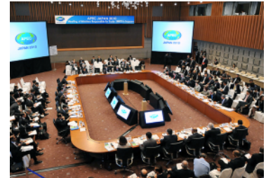
APEC 貿易担当大臣会合の様(札幌市)

この会合は、成長著しいアジア太平洋の21の国と地域から、大臣をはじめ政府・関係機関関係者、報道関係者など、数百人が集まる大規模な国際会議です。これほど大規模な国際会議が岐阜県で開かれたことはなく、県ではこの機会を捉え、地元関係機関と一体となって、県内の産業、観光資源等を広くPRするとともに「おもてなし」の心で参加者の歓迎や交流を行います。