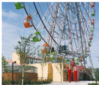
アクア・トト・ぎふに隣接する 大観覧車「オアシスホイール」

河川環境楽園へは東海北陸自動車道川島PAから 高速道路を降りずに入園ができ、とても便利です