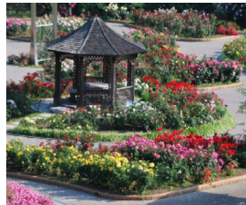
花フェスタ記念公園