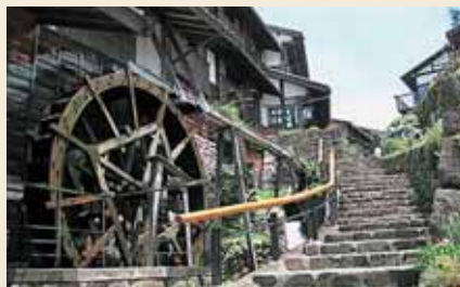
馬籠宿の水車小屋