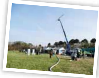
映画「キツツキと雨」 撮影風景

岐阜フィルムコミッションは、今年で設立10年目! 映像媒体を通じて「岐阜」の魅力や情報を発信することにより、「岐阜」の知名度向上やイメージアップに繋げる活動をしています。