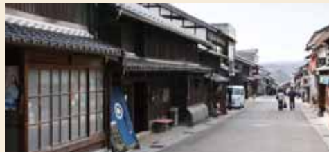
歴史あふれる「岩村城下町」

歴史あふれる女城主の里「岩村城下町」は、訪れた人を、どこか懐かしい気持ちにさせてくれます。平成25年2月には電線地中化が終わり、さらに綺麗な街並みになりました。