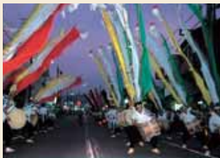
風流(ふりゅう)おどり

毎年8月12日・13日に行われる夏祭りで12日は納涼花火大会、13日には本祭りが行われます。本祭りの一番の見どころは約400年前の絵図を再現した風流(ふりゅう)おどり。各企業による創作みこしの練り歩き等もあり会場は熱気で包まれます。