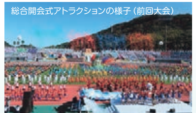
総合開会式アトラクションの様子(前回大会)