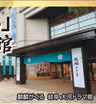
麒麟がくる 岐阜大河ドラマ館