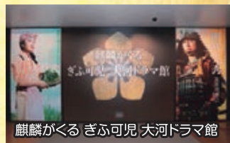
麒麟がくる ぎふ可児 大河ドラマ館