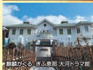
麒麟がくる ぎふ恵那 大河ドラマ館