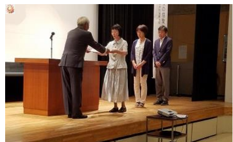
【表彰式の様子から】