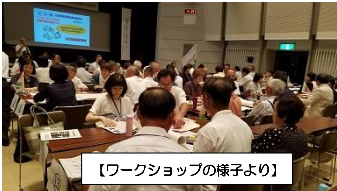
【ワークショップの様子より】