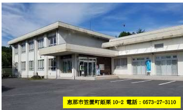
恵那市笠置町姫栗 10-2 電話：0573-27-3110

カフェや感謝会に持ち寄りおやつの作り方の情報交換が賑やかで、30年度に持ち寄ったピザパンが、早速令和元年度の計画になり、持ってきた母親が講師となってみんなで作るようになりました。良いと思った事を柔軟に実行に移しています。OBが託児に協力するなど、事業やカフェを通して温かく愛着ある学級に育っています。