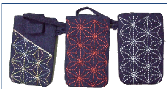
[ iPhone ケース ]