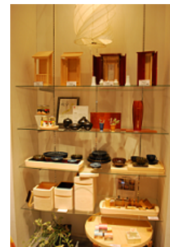
岐阜県商品常設コーナー