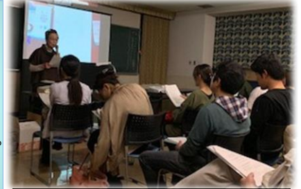
原田氏の講話「人生の友になる本を」