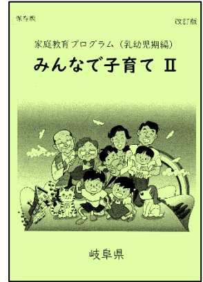
改訂版 家庭教育プログラム (乳幼児期編) みんなで子育てⅡ