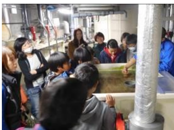
アクア・トトぎふバックヤード探検