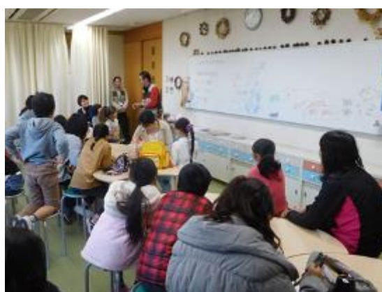
自然環境プログラム (絶滅危惧生物を知ろう)