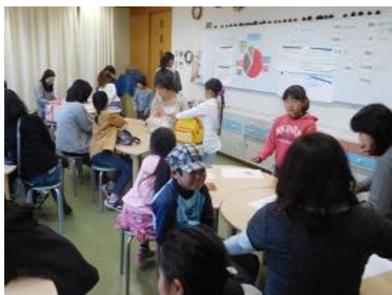
自然環境プログラム (川を汚したのは誰?)