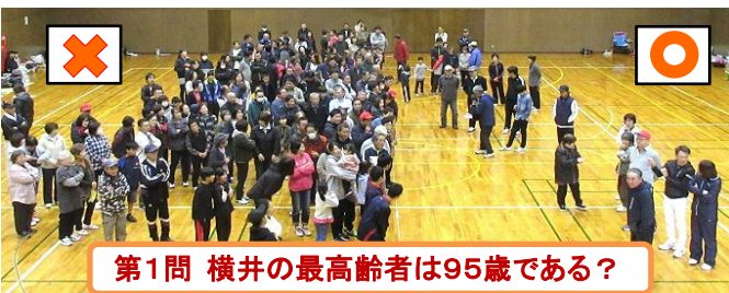
第1問 横井の最高齢者は95歳である?