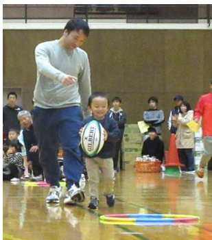
私もトライ! 息を合わせて1, 2