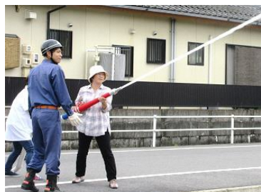
消防団員・婦人防火クラブ員