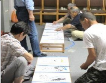
容姿は似ても味は叶わぬ 行灯作り (10日)