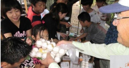
卵2パックをゲット！

お地蔵さんは、石仏で立派なお厨子の中に安置されており、灯明台には文明（1470年代）の年号がきざまれています。大昔の洪水で地蔵堂が流され横井の西の田んぼに埋もれておられたお地蔵さんを見つけて、現在地に地蔵堂を建立、安置されたと伝えられています。今の地蔵堂は、昭和49年に再建されたものです。北側には、横井分教場（昭和31年廃校）がありました。