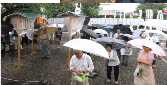
例祭の準備にあたっていただいた 中屋敷の皆さんと 協議員