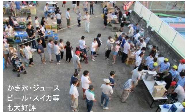
かき氷・ジュース ビール・スイカ等も大好評