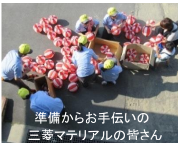
準備からお手伝いの三菱マテリアルの皆さん