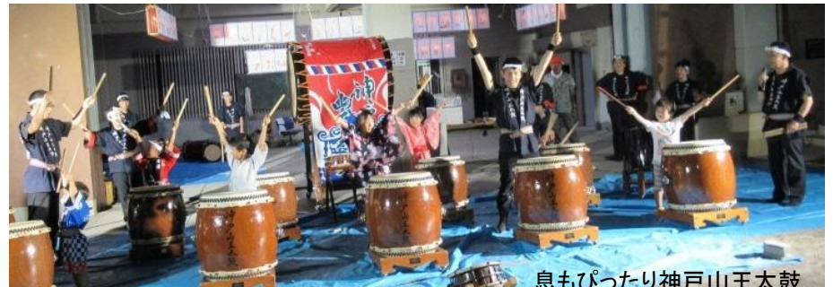
息もぴったり神戸山王太鼓

各組織の役員の皆さんを始め、三菱マテリアル(株)様からは総勢16名の社員の方々の応援を頂き、午前8時から準備作業開始です。日中の猛暑を避けて暫し休憩。15時からの継続作業も順調に進み、18時の区長の挨拶で始まりです。幾分猛暑も和らぎ、やがて参加者も400名を超し大いに盛り上がりました。格安の出店も賑わい、キッズコーナーの各種ゲームも大変人気を呼んでいました。最後の空くじ無しの抽選会は、ドキドキしながらも楽しいひと時でした。