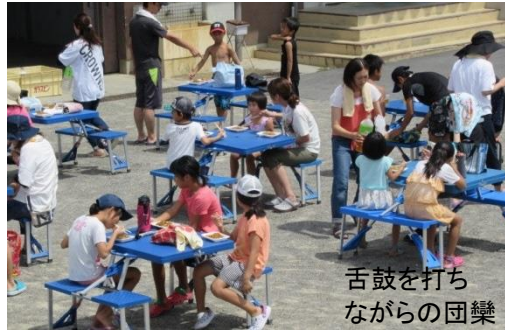
舌鼓を打ちながらの団欒