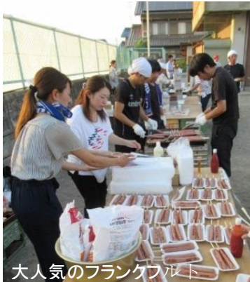
大人気のフランクフルト