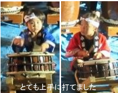
とても上手に打てました