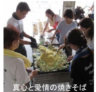
真心と愛情の焼きそば

横井区と子ども会の協賛で、毎年実施されている第一回週末支援事業が行われました。開始11時頃の気温は28℃程。親子連れなど89名の参加で大盛況です。プールに放たれた100匹のアユは、猛スピードで逃げ回るものの子供達には勝てません。焼き立てアツアツのアユと焼きそばは、とても美味しい絶品でした。