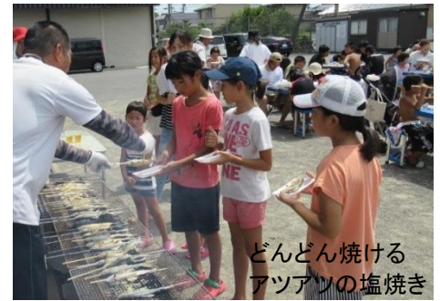
どんどん焼けるアツアツの塩焼き