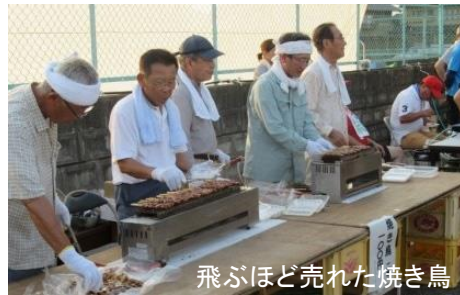
飛ぶほど売れた焼き鳥