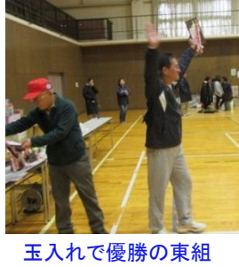
玉入れで優勝の東組