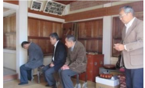
氏子総代の皆さんと副区長(司会)