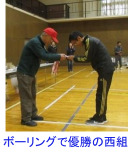
ボーリングで優勝の西組