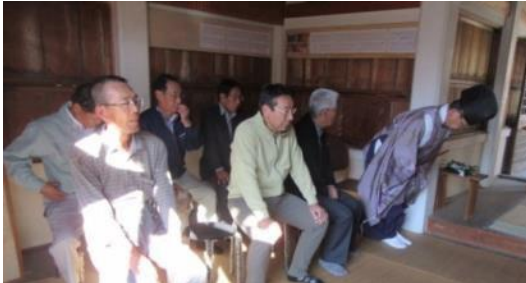
各種団体代表の皆さん

今年も天候に左右される事も無く、豊かな五穀豊穡の恵みに感謝して、新嘗祭が行われました。高田宮司の丁寧な祝詞奏上に続き、氏子総代並びに区三役・各種団体の代表の皆さんによる玉串が厳かに奉奠されました。