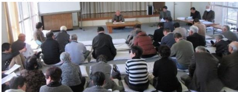
長寿会・平成28年度定期総会