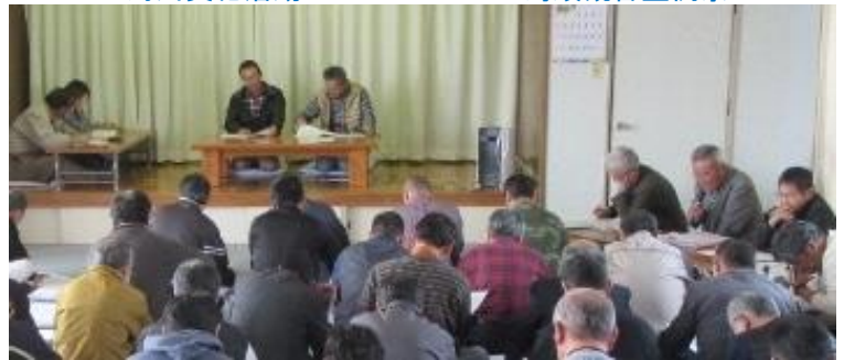
横井区・平成28年度定期総会

平成28年度定期総会が出席者106名委任状49名にて成立・開催され、全ての議案が滞りなく承認可決されました。