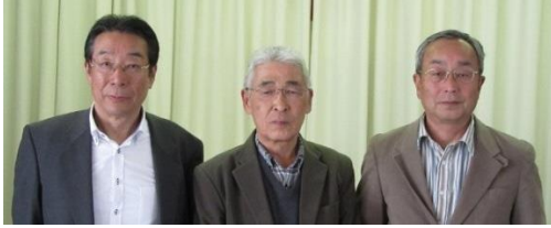
森 会計 林 区長 林 副区長

平成28年度も、区及び各種団体役員の皆さんを始め、区民の皆さんのご協力のもと、全ての事業・行事を計画通り、推進することが出来ました。有難うございました。