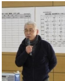
北地区公民館長挨拶