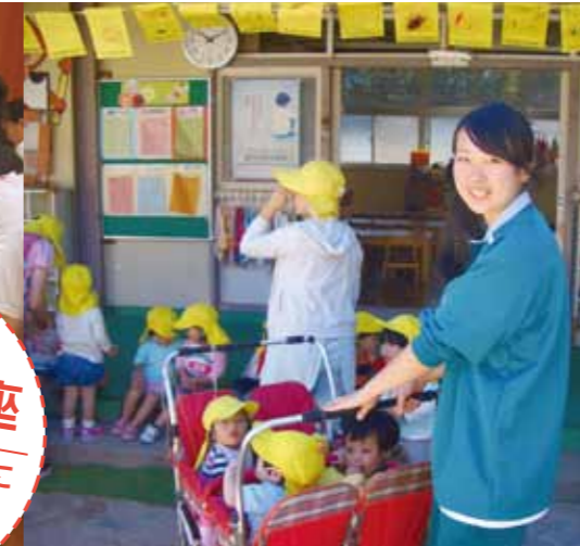
保育園での職場体験学習