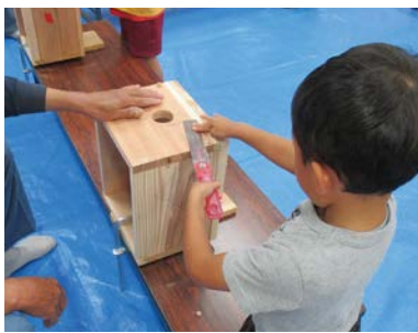
道具を使用し、棚を組み立てる園児の様子

また、自らキットを組み立てる作業では、こだわりを持って丁寧に扱ったり、一つの作業で高い集中力を持って行っていたりなど、その子が持つ新たな個性を発見できる機会にもなっており、教育面での効果も高い事業となっています。