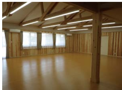
きらら美濃加茂(美濃加茂市)