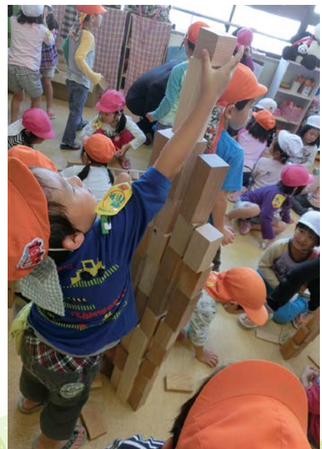
おもちゃで遊ぶ園児の様子