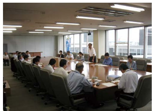
第1回事業評価審議会(県庁)