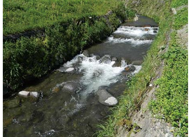
大間見川(郡上市)における魚道の改善状況【左：改善前 右：改善後】