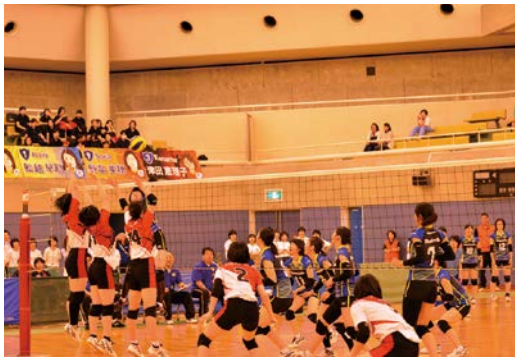
水の都杯9人制女子バレーボール選抜 優勝大会(大垣市バレーボール協会)