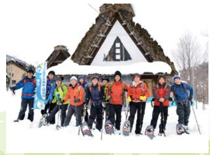
ガイドの育成 (研修実施状況) (白川郷 自然共生フォーラム)