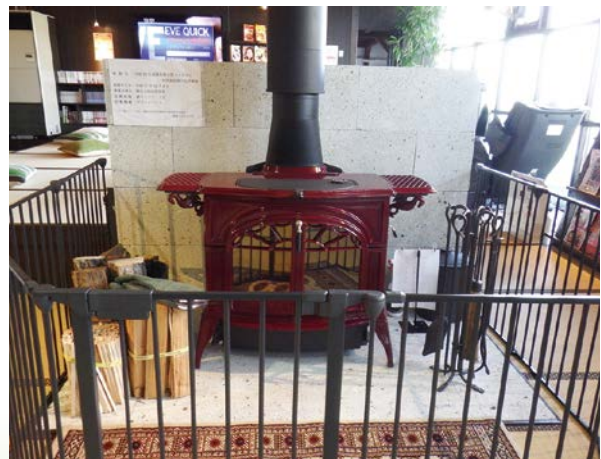
恵みの湯(各務原市)