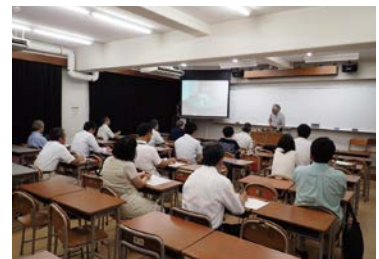
教員免許状更新講習H27.6.28 「野生動物の管理学について」