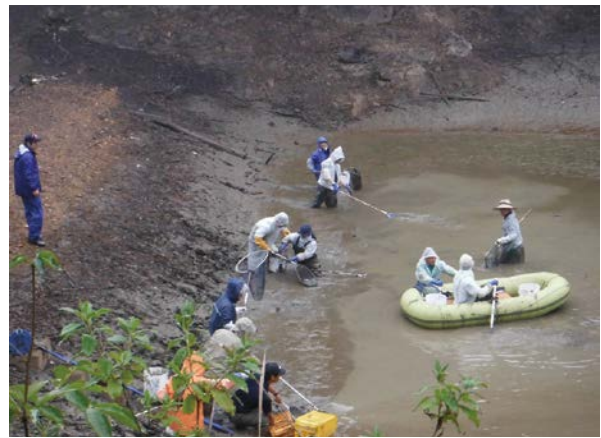
捕獲状況 一井戸上上の池(多治見市)一