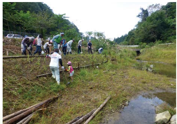
ビオトープづくり