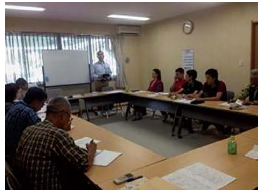
エコツーリズム経営セミナー