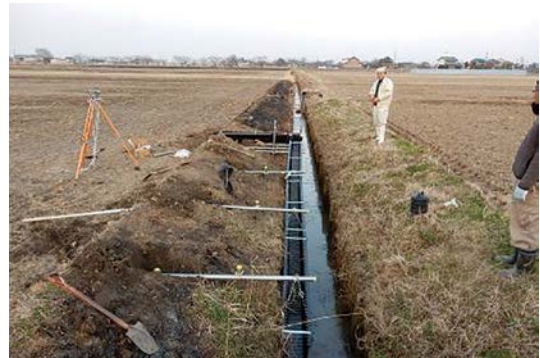
設置状況(海津市南濃町地内)