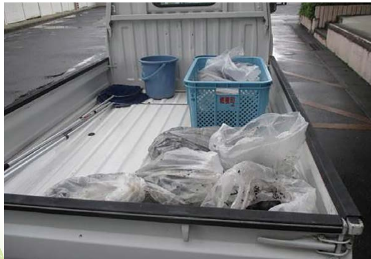
駆除したスクミリンゴガイ【通称：ジャンボタニシ】(瑞穂市)