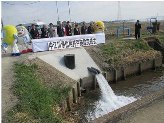
中江川浄化用井戸施設完成式