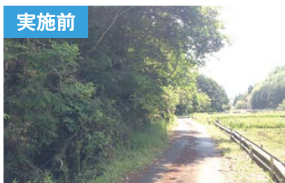
実施前 バッファゾーンの整備(美濃加茂市内)