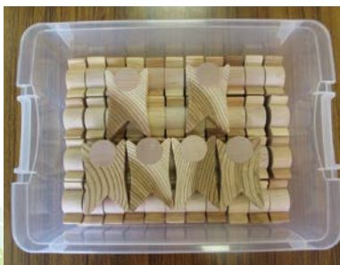
導入製品(つみぼぼ)