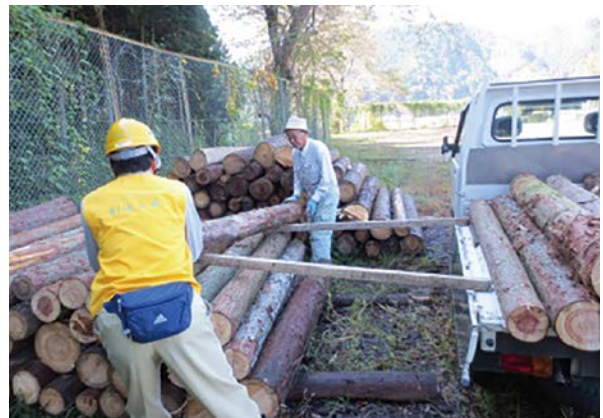
「木の駅」inつぼがわ活動組織(関市)