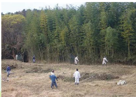
公園候補地での保全作業(上白金生態景協議会)