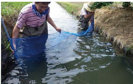
排水路の生物相調査

水田魚道の設置に有効な場所や条件等を検証するため、水路に生息する魚類等の調査や遡上・降下調査を実施しました。また、河川の合流点における落差工の有無の影響を検証しました。