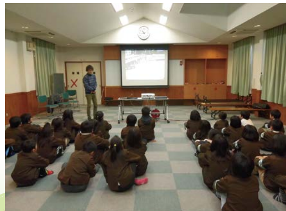
岐阜大学と連携した環境学習の事前講義