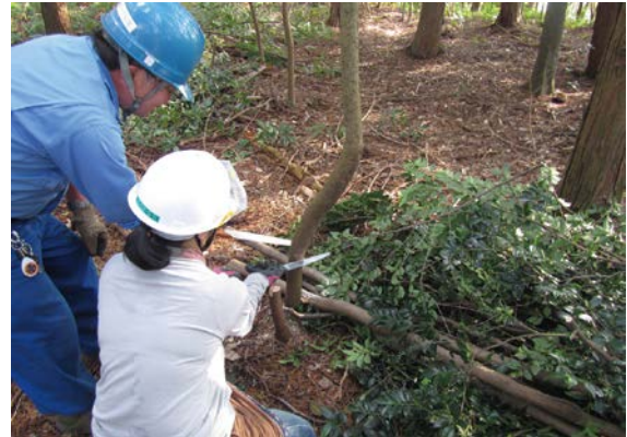
里山案内人講座の開催 (可児市)

特徴的な事業例として、新たに整備した庁舎への木製家具の設置(北方町)、全国育樹祭併催行事への来場者に地域の自然を紹介する巨樹・巨木林ツアーの開催(高山市)、低中層湿原での地元住民の方々と協働した環境調査の実施(瑞浪市)等が挙げられます。