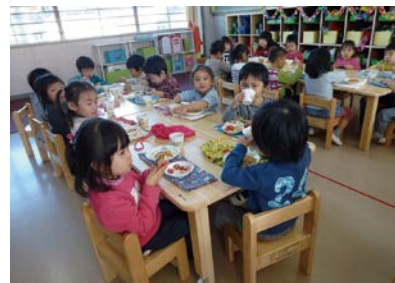
沖ノ橋保育園(岐阜市)