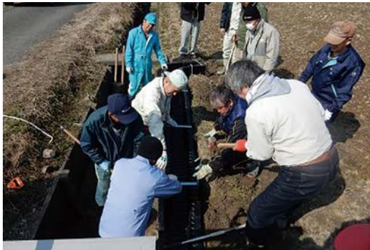
設置状況(大垣市川口町地内)

講師の指導による参加者が自ら組み立て設置する現場研修を実施し、水田魚道の設置促進を図りました。