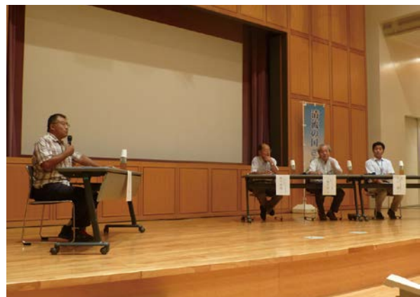
生物多様性シンポジウムの様子