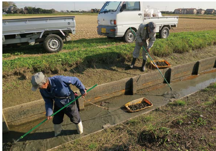
水路での駆除作業状況(輪之内町)