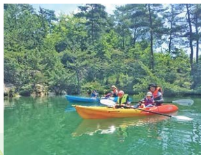
エコツアーのガイダンス・プログラムの作成 (カヤックモデルツアー) (中津川観光協会)