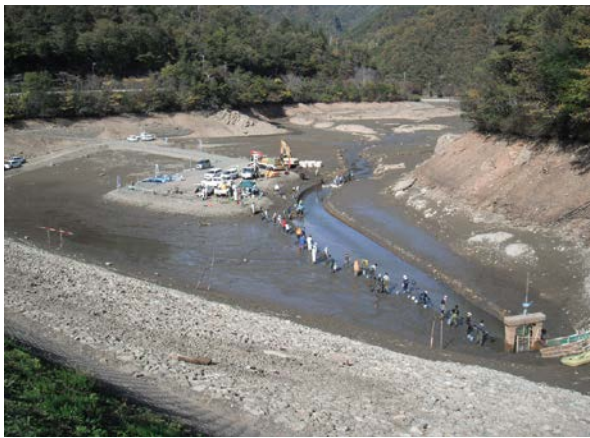
捕獲状況 一伊自良溜池(山県市)一

延べ参加者数：253名(地元及び市町村職員：96人、建設コンサルタント：26人、県職員：75人、その他：56人)