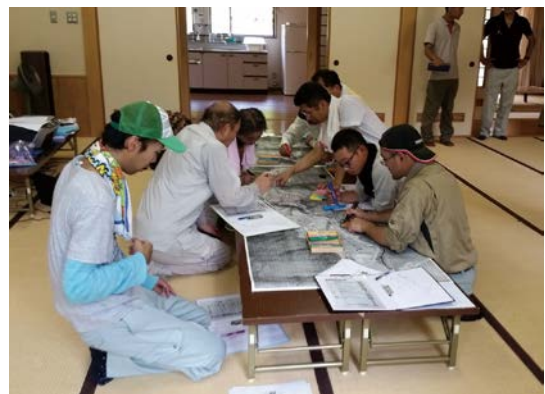
わな捕獲を中心とした捕獲体制モデル事業 集落環境点検の様子