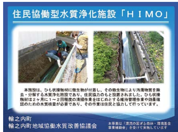
ひも状接触材を利用した住民協働型水質浄化施設