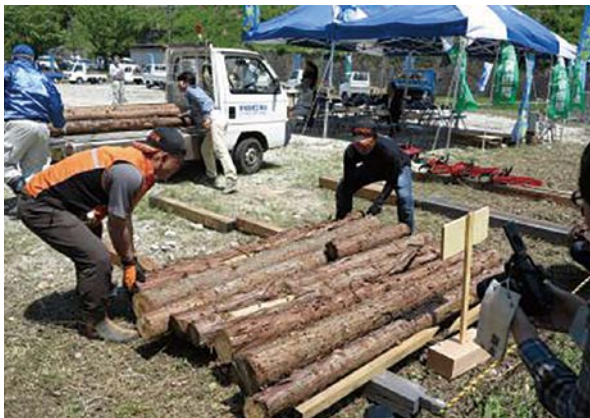
つけち木の駅プロジェクト実行委員会(中津川市)