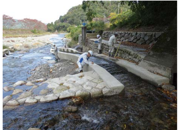
FWSによる魚道点検状況【左：飛鳥川(揖斐川町) 右：牧田川(大垣市)】