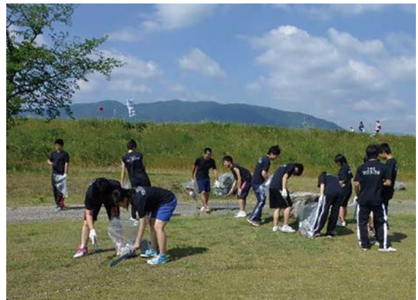
揖斐川流域(揖斐川町)