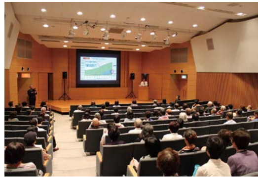
せいとういきいき終活フェア2015 (一般社団法人 相続安心支援センター)