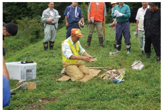
わな捕獲技術向上研修会(実技研修) (高山会場の様子)