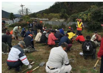
わな捕獲技術向上研修の指導 H27.11.29