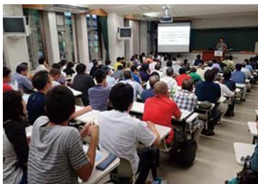
シンポジウムH27.8.30 「新米猟師のための 超速!捕獲技術向上法」