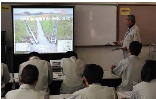
講義(水田魚道の概要や設置方法)