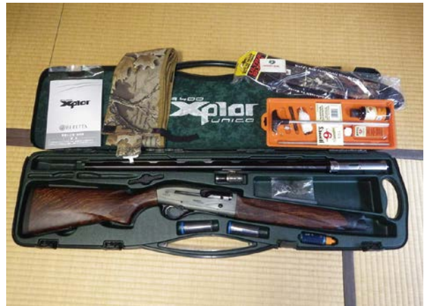
本事業を活用して購入した銃器 (下呂市提供：平成27年度実施)