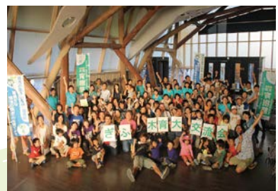
ぎふ木育大交流会