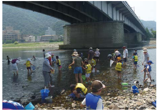
長良川の生きものしらべ