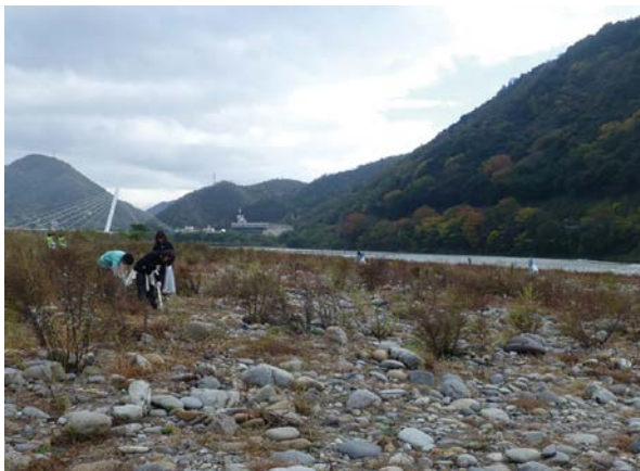
長良川流域(岐阜市)