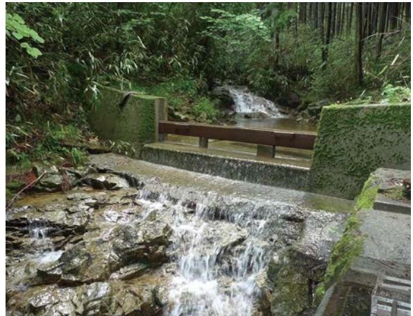
上流の水源地域内で約19haの森林が公有化された 取水施設(八百津町)