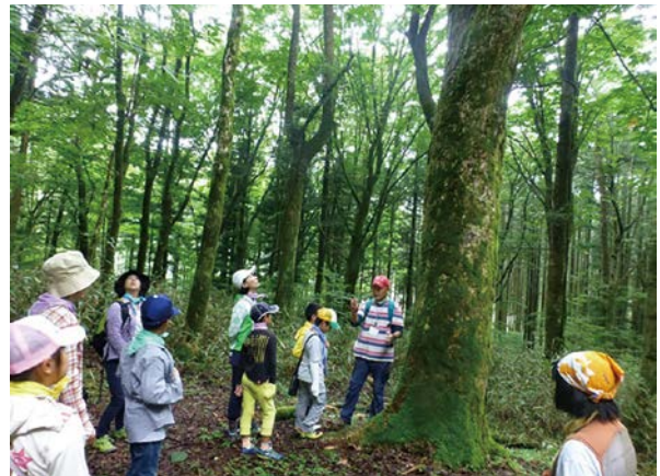
自然散策(中津川市・けやき平公園)