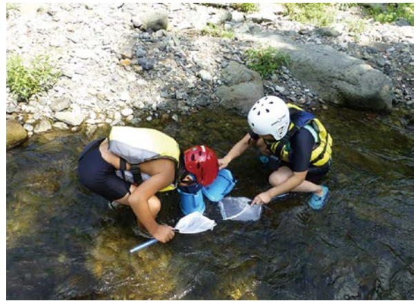
川の生き物観察(揖斐川町・水と森の学習館)