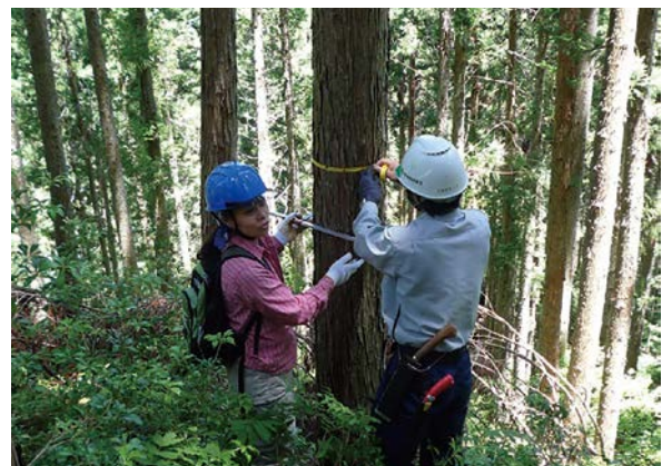
水源地域内の樹木調査(恵那市)