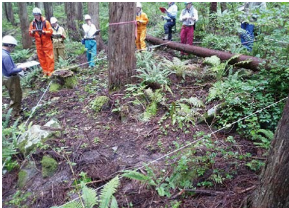
水源地域内の下層植生調査(郡上市)

森林機能の評価に関する活動を行う3グループの指導を岐阜大学に委託し、調査結果の分析及び大学の有する知見を加えた森の通信簿を作成しました。