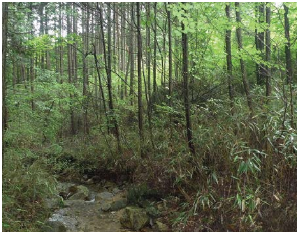
公有林化された森林(八百津町)