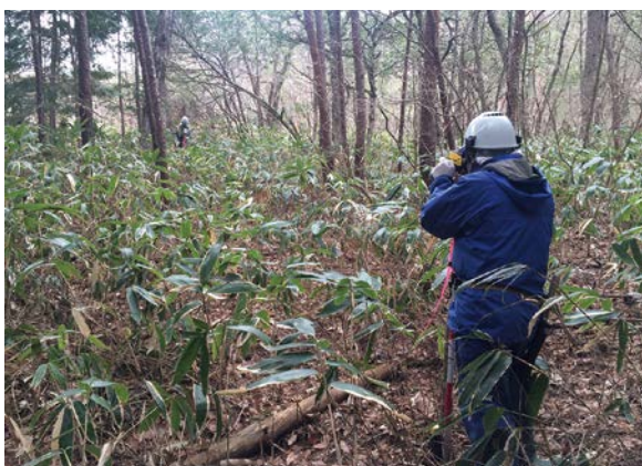
現地調査(測量作業)