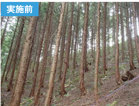
高山市丹生川町 地内