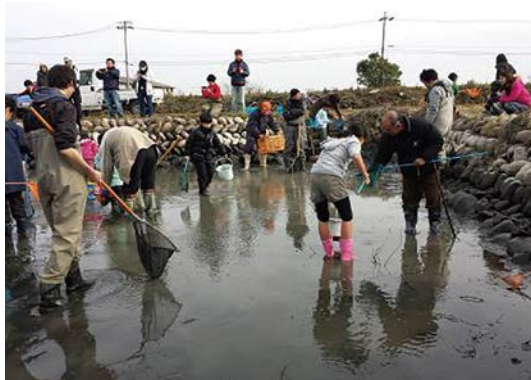
池干しと生きもの調査(東海タナゴ研究会)