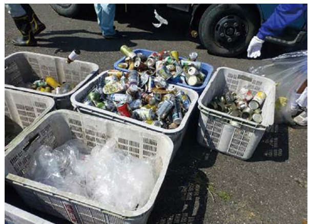
回収したゴミの一部