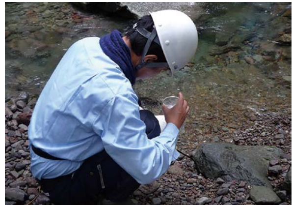
水源地域内の水質調査(郡上市)