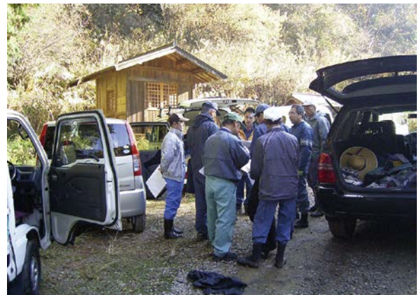
現地調査(杭打ち作業)