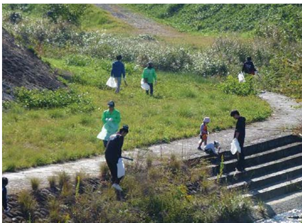
土岐川流域(多治見市)