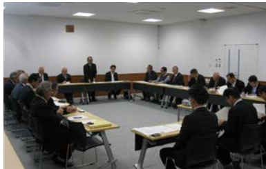
整備・活用計画策定会議