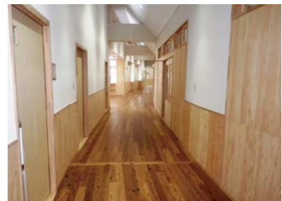
多治見市立星ヶ台保育園(多治見市)