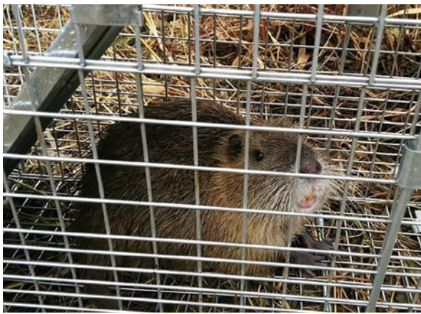
捕獲オリと捕獲されたヌートリア

住民に貸し出す場合には、捕獲に関する研修を受講いただくことを基本としており、安全に捕獲活動が行われるように留意しています。