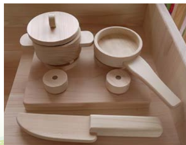
導入製品(木ままごとセット)