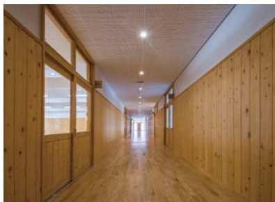
海津市立城南中学校(海津市)