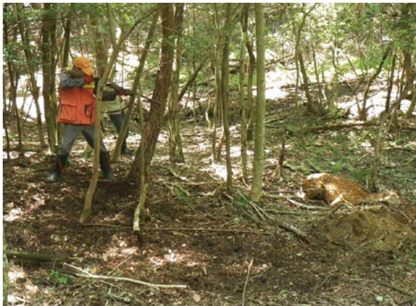
ニホンジカの捕獲 (平成24～27年度実施)

平成27年度に銃猟免許を取得した職員は、平成28年度から有害捕獲隊員として、地域の鳥獣被害防止に貢献すべく活動をしていきます。