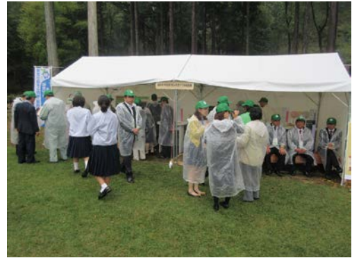
全国育樹祭でのPR(揖斐川町)