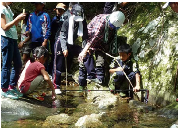
水源地域内の河川調査(白川町)