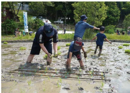
再生した耕作放棄地での田植え(かわせみの杜 関山田・棚田の会)