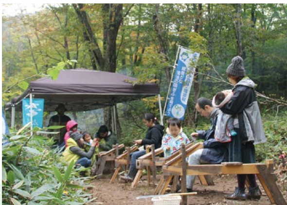
森の色えんぴつづくり