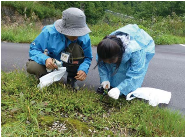
外来植物(オオバコ)の駆除活動(飛騨市・天生県立自然公園)