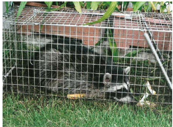
捕獲オリと捕獲されたアライグマ