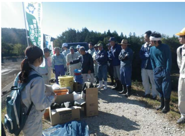
開始前ミーティング 一上之平2号(中津川市)一