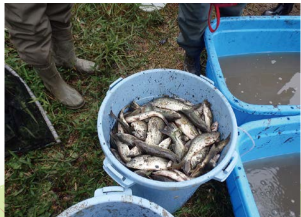
捕獲した外来種 一上野池(美濃加茂市)一