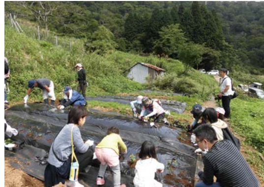
再生した耕作放棄地での葎草栽培(山菜の里いび)