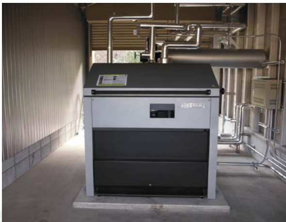
明宝デイサービスセンター(郡上市)