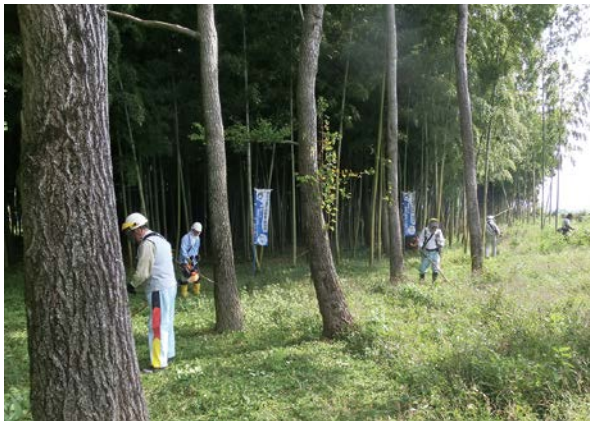
里山林・竹林の整備