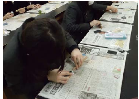
木のスプーンづくり