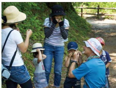
ガイドの育成 (自然参加プログラム実施状況) (中津川観光協会)