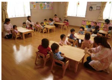
正木保育園(羽島市)