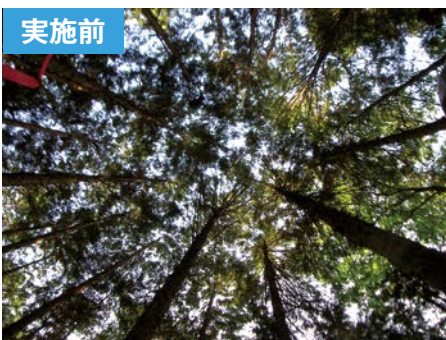
郡上市和良町 地内