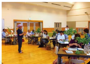
サポーター養成研修