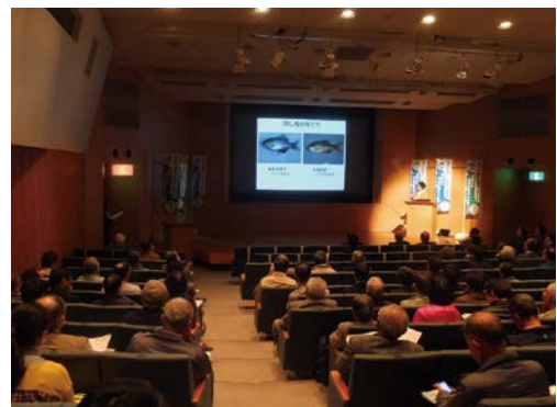
森林・環境税に関する県民フォーラム(大垣市)