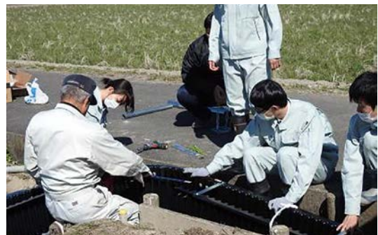
現場研修(生徒による魚道の設置)