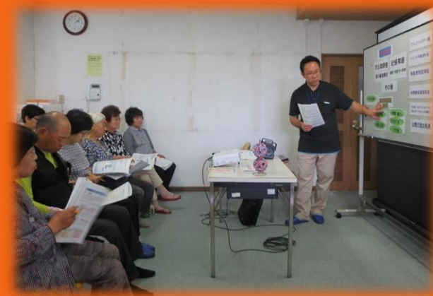
介護者家族の会で・・・