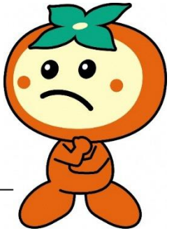
瑞穂市マスコットキャラクター かきりん