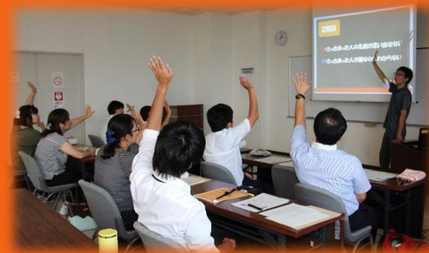
先生のための福祉講座で・・・