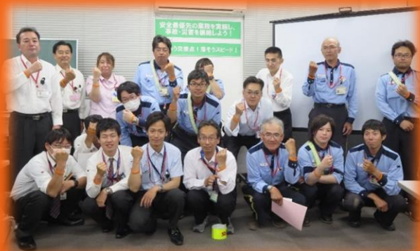
市内の郵便局さんに・・・

各種団体に『認知症サポーター』を養成し、認知症になっても安心して暮らせるまちを目指しています。