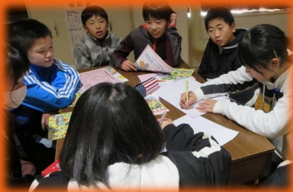
市内の小学校で・・・