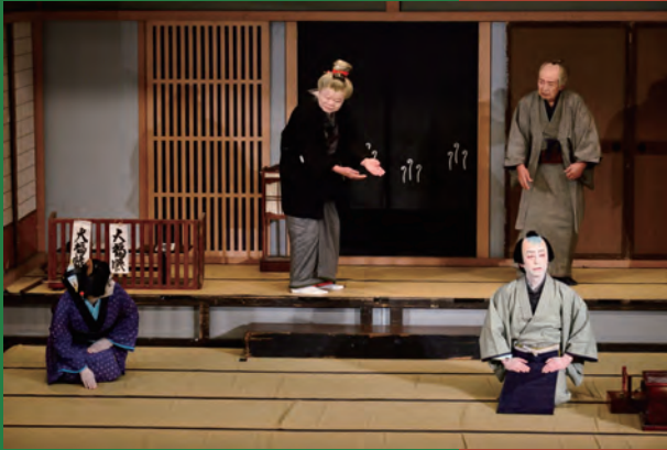
鳳凰座 歌舞伎公演「八百屋献立」