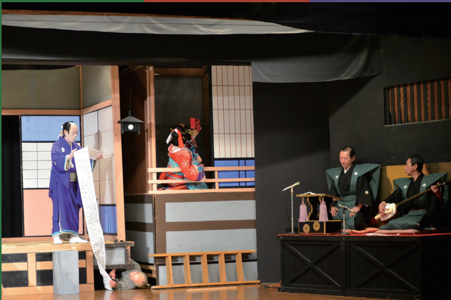
鳳凰座 歌舞伎公演 「一力茶屋」