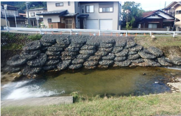
(H28: 高山市苔川での護岸補強例)