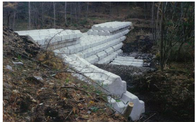
(H26: 長野県木曾町での仮設えん堤例)